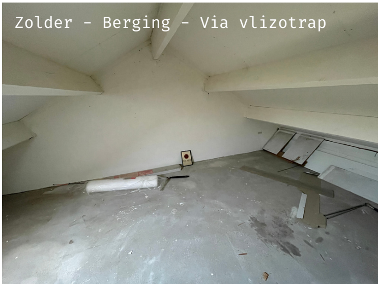
Zolder - Berging - Via vlizotrap